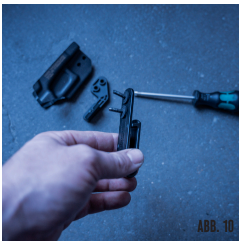
ABB. 10-12 - BEI DER MONTAGE DES IWB CLIPS UND DES AP WING, ZUERST DIE SCHRAUBEN DURCH DEN CLIP, DANACH DIE SCHRAUBEN MIT DEN 2 DÜNNEREN PUFFERN FIXIEREN, DEN WING DRÜBER LEGEN UND ZUSAMMEN MIT DEN GEWINDEHÜLSEN AM TG VERSCHRAUBEN.