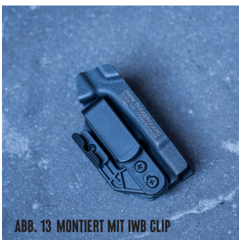
ABB. 13 MONTIERT MIT IWB CLIP